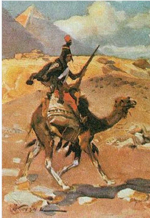
Een soldaat van het Dromedarisregiment, door Wojciech Kossak , 1912.