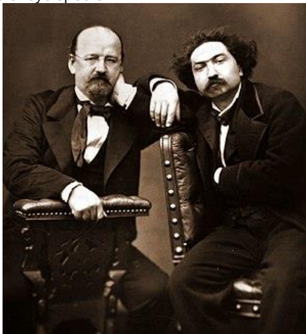
Woodburytype van Émile Erckmann en Alexandre Chatrian circa 1875

Erckmann-Chatrian was de naam die werd gebruikt door de Franse auteurs Émile Erckmann (1822-1899) en Alexandre Chatrian (1826-1890), van wie bijna allemaal gezamenlijk werken werden geschreven. [1]