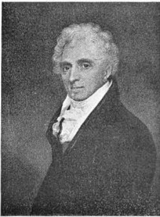
Col. Mark Wilks.

Wilks (Mark), 1760 – 1831. Gouverneur van Sint-Helena van juni 1813 tot april 1816 toen hij vervangen werd door Hudson Lowe.