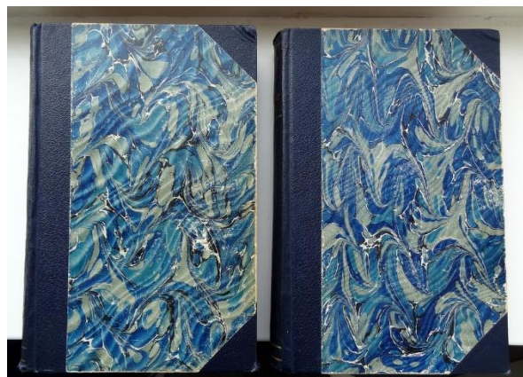
Mémoires van Gourgaud